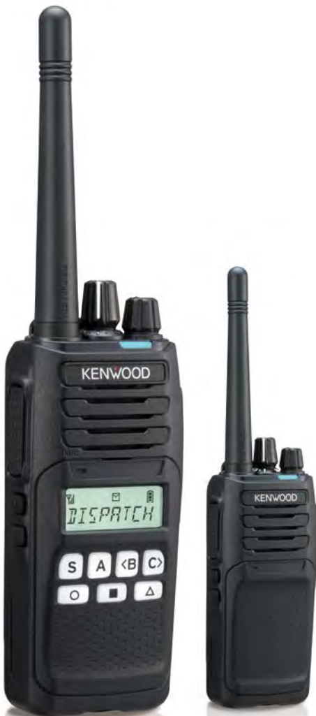
Modelo con teclado estándar