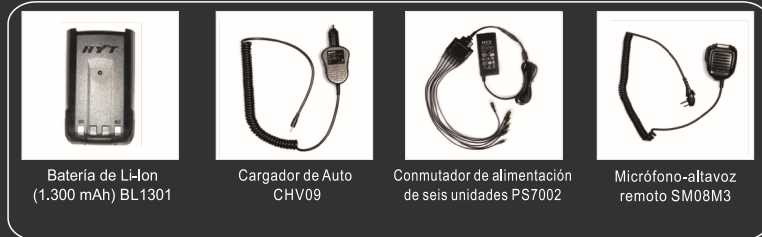
Batería de Li-Ion (1.300 mAh) BL1301

Nota: las imágenes son solo de referencia y pueden diferir del producto real.