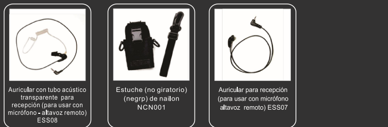
Auricular con tubo acústico transparente para recepción (para usar con micrófono - altavoz remoto) ESS08