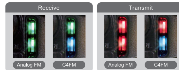
Indicador de modo

La función AMS (Selección automática de modo) reconoce automáticamente la señal recibida como C4FM digital o FM convencional, conmutando el receptor al modo adecuado. La función AMS permite el funcionamiento fluido acabando con la necesidad de conmutar de forma manual entre los modos de comunicación. Los indicadores de MODO muestran de un vistazo el modo de Transmisión/Recepción.