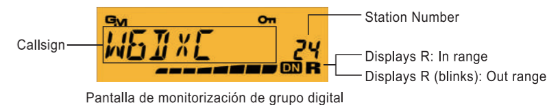
Pantalla de monitorización de grupo digital

Durante la comunicación en modo digital C4FM, la función digital GM advierte de forma automática al usuario si los miembros del grupo están dentro del rango de comunicación, y muestra en la pantalla la información de su ID o su indicativo de llamada.