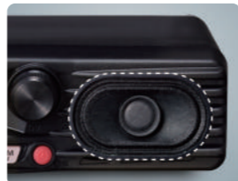
Altavoz frontal de 3 Vatios (35 x 58 mm)

El altavoz frontal proporciona un nivel de audio potente de 3 vatios. El sonido del altavoz del FTM-3200DE y FTM-3100E ha sido ajustado para incluso una mejor calidad de sonido. Un altavoz externo MLS-100 opcional soporta la operación en entornos de campo ruidosos.